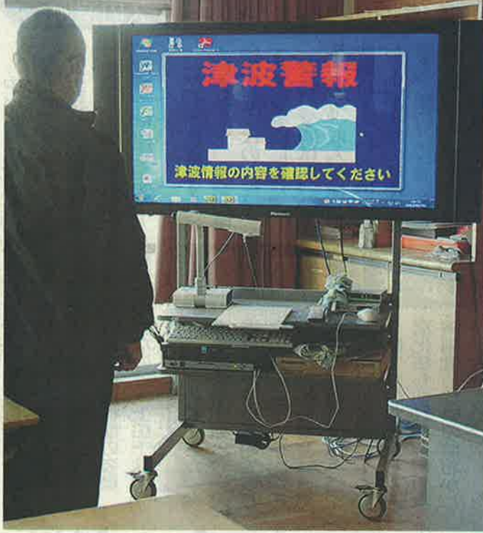
津波警報などが出ると、教室の電子黒板に表示される。木曾岬町の木曾岬小学校で

東海、東南海などの大地震と津波に備え木曾岬町は、町内の小中学校に、気象庁の緊急地震速報とNHKの緊急警報放送を受信し、校内に知らせる設備を初めて。 一 整えた。校内放送で流れると同時に、教室の電子黒板や職員室のパソコンに表示される。こうした設備の学校への導入は北勢地方では初めて。 町内には小中が一校ずつあり、電子黒板は小学校に十五台、中学校に八台を配置。これを活用し、児童や生徒が授業中でも目と耳から情報を得られるよう